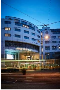
Congress Center Basel Aussenansicht

Bilder-Download unter www.congress.ch/bilder