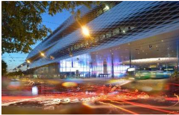
Moderne Infrastruktur der Architekten Herzog & de Meuron